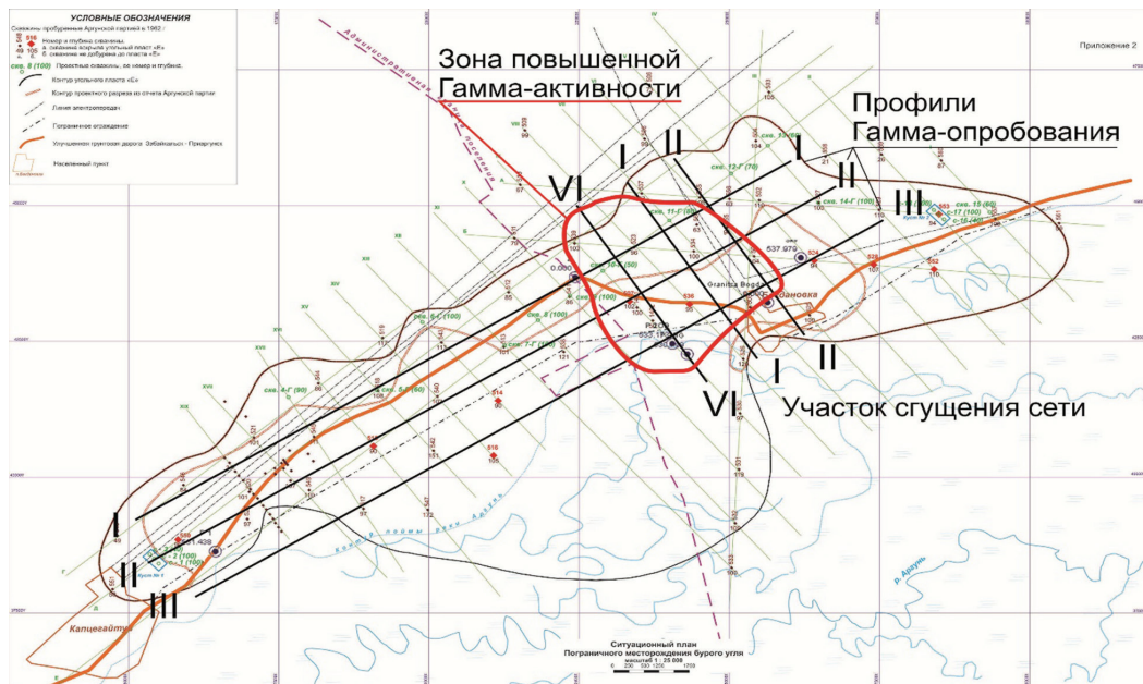
Рис. 4. Схематический план Пограничного месторождения бурого угля с сетью гамма-опробования. Масштаб 1: 100 000 (в 1 см. – 1 км) / Fig. 4. Schematic plan of the Pogranichnoye brown coal deposit with a network of gamma sampling. Scale 1: 100,000 (in 1 cm – 1 km)

Схематический план Пограничного месторождения бурого угля с сетью гамма-опробования представлен на рис. 4.